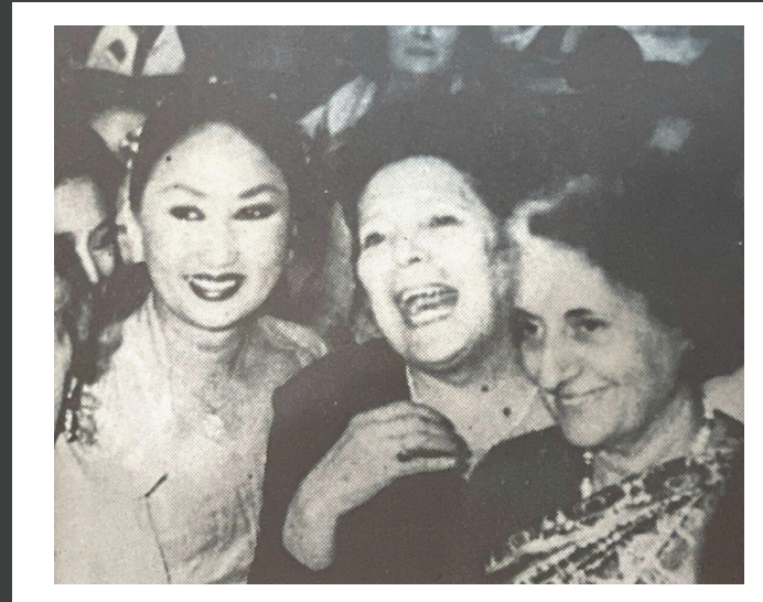
Indira Gandhi (India)