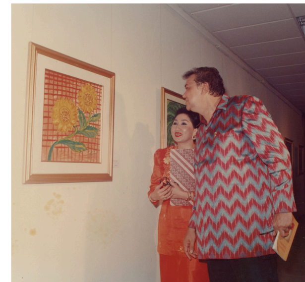
Bpk Joop Ave (Menteri Pariwisata, Pos dan Telekomunikasi RI) Periode: 1993-1998