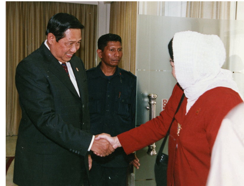
Bpk Susilo Bambang Yudhoyono (SBY) (Presiden ke-6 RI) Periode: 2004-2009 & 2009-2014