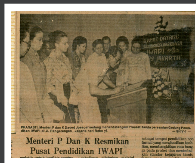
Pusat Pendidikan IWAPI