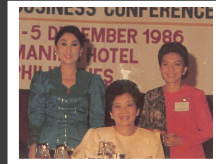
Corazon Aquino (Filipina)