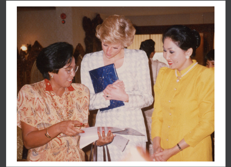
Lady Diana (Britania Raya)