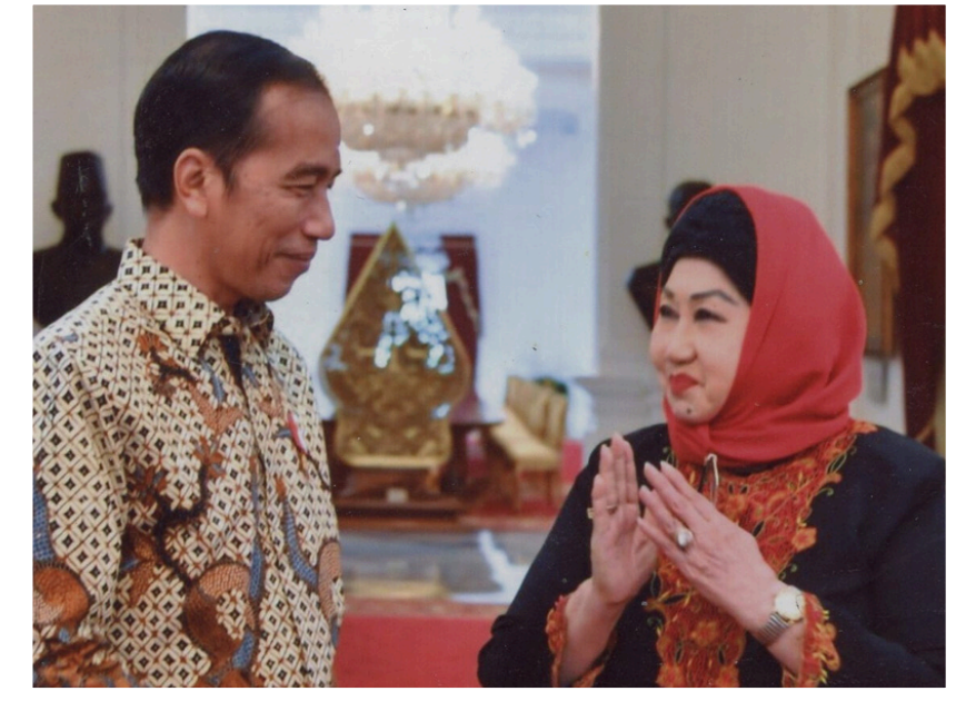
Bpk Joko Widodo (Jokowi) (Presiden ke-7 RI) Periode: 2014-2019 & 2019-2024