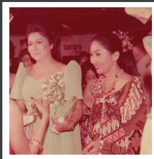
Imelda Marcos (Filipina)