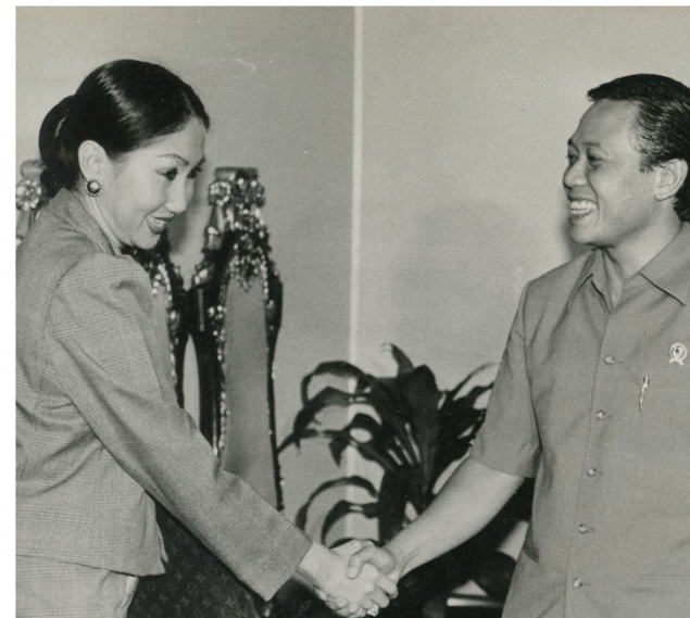
Bpk Harmoko (Menteri Penerangan RI) Periode: 1983-1997