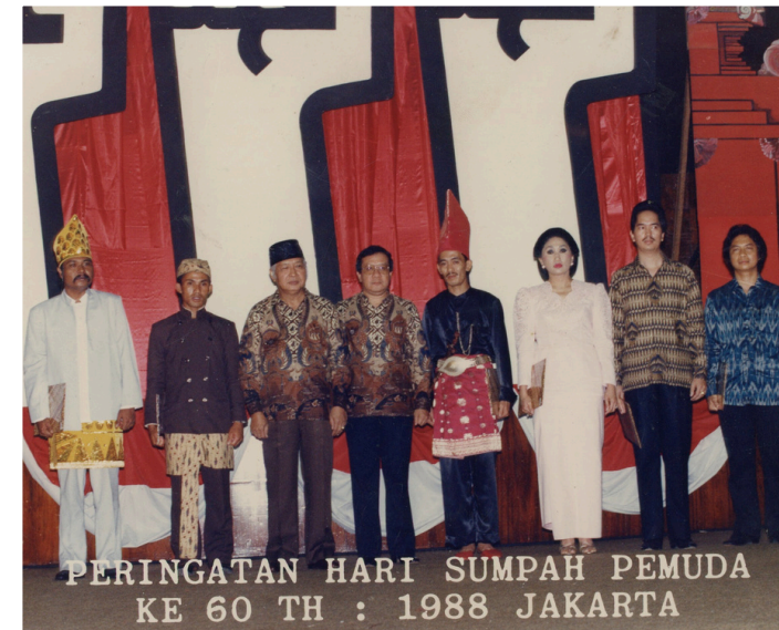
Bpk Akbar Tanjung (Menteri Pemuda dan Olahraga RI) Periode: 1988-1993