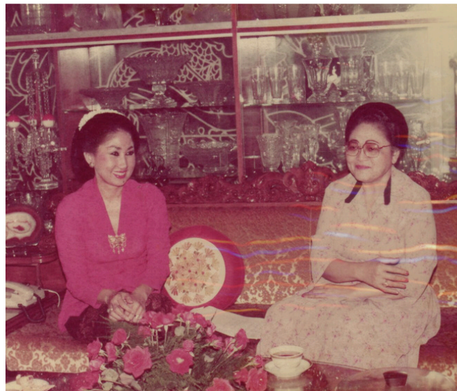
Ibu Tien Soeharto (Istri Presiden ke-2 RI)