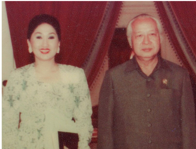
Bpk Soeharto (Presiden ke-2 RI) Periode: 1967-1998

Dukungan dan apresiasi yang diterima beliau dari para pemimpin bangsa menunjukkan bagaimana kontribusinya diakui dalam membangun Indonesia yang lebih baik.