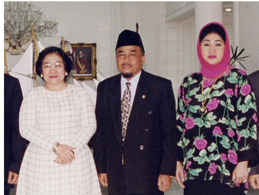
Ibu Megawati Soekarnoputri (Presiden ke-5 RI) Periode: 2001-2004