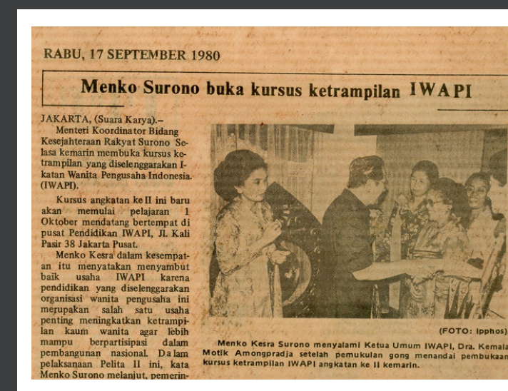
Kongres IWAPI & Kursus Ketrampilan